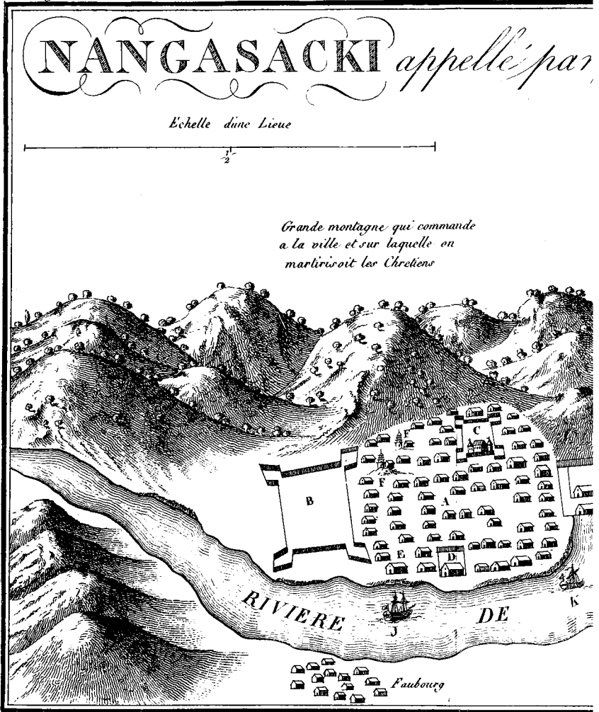
A. Portier Sculp

de Haren, dans ses Recherches historiques sur l'état de la